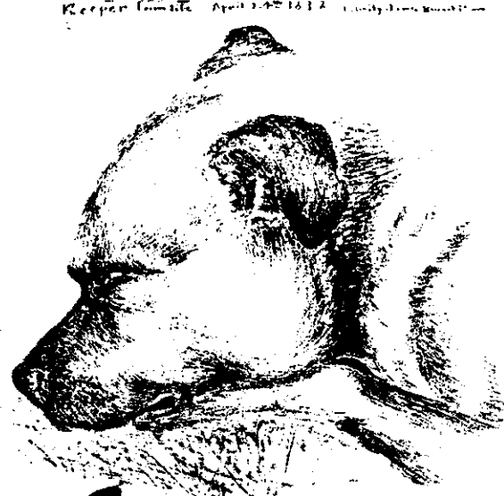
'Keeper - from life - April 24th 1838.' Emily Brontë, aged nineteen, home from Halifax, drew her father's new, fierce house-dog. She tamed him with her bare fists. He loved her.

ヒューマンの反Humanism的宗教心の伝統を受け継ぎ、モーリヤックやベルナスの描く人 間の魂の闇の部分に強対峙する魅かれたグリーンの作品は、40年代の『大人しいアフリカ人』以来、主 題は、 おべりア旅は彼を向ヒューマン・ファクターに、作家の少年のみならず、アフリカの大陸は『心臓の形』とい う、 と、 と、